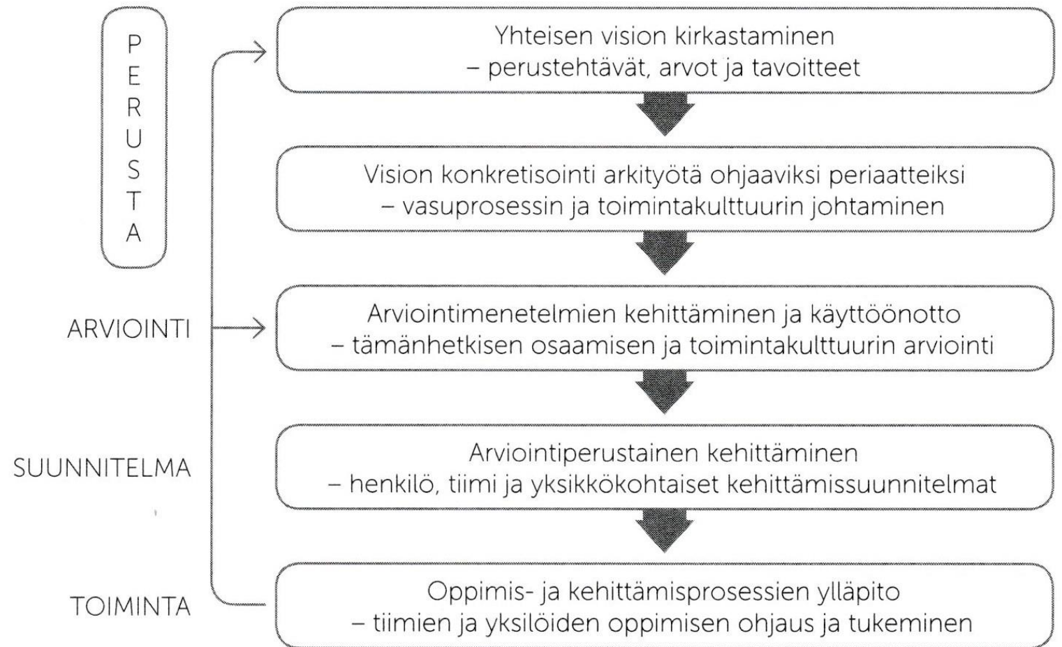
Kuvio 1. Pedagogisen johtamisen prosessi (Parrila 2015)

Kuva kirjasta Parrila & Fonsén (2016): Varhaiskasvatuksen pedagoginen johtajuus. Käsikirja käytännön työhön.